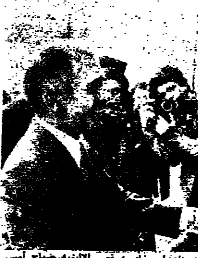
الملك حسين يلتقي بيسكار ديستان

وفي مساء زار بطرس القصر الجمهوري وتلقى من الرئيس سركيس مجمل ملاحظته مع المستر لاين. وقال ناطق باسم السفارة الأميركية أمس إن المستر لاين عرض مع وزير الخارجية اللبناني «المحادثات الجديدة» التي من شأنها أن تساهل في حلحلة أزمة لبنان. وقال ناطق باسم السفارة الأميركية أمس إن المستر لاين عرض مع وزير الخارجية اللبناني «المحادثات الجديدة» التي من شأنها أن تساهل في حلحلة أزمة لبنان. وقال ناطق باسم السفارة الأميركية أمس إن المستر لاين عرض مع وزير الخارجية اللبناني «المحادثات الجديدة» التي من شأنها أن تساهل في حلحلة أزمة لبنان.